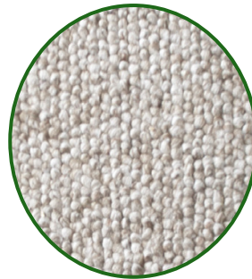
Alfombras y Moquetas