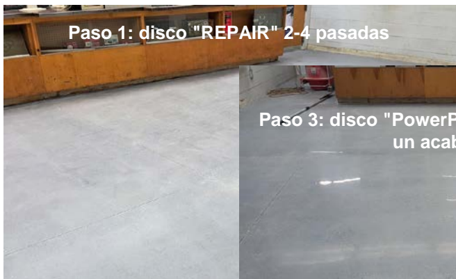
Paso 1: disco "REPAIR" 2-4 pasadas

¿Cómo conseguir un suelo con un alto brillo y de aspecto mojado?