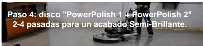
Paso 4: disco "PowerPolish 1 + PowerPolish 2" 2-4 pasadas para un acabado Semi-Brillante.