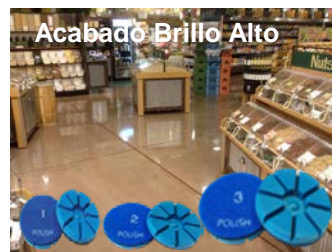
Acabado Brillo Alto