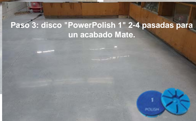
Paso 3: disco "PowerPolish 1" 2-4 pasadas para un acabado Mate.