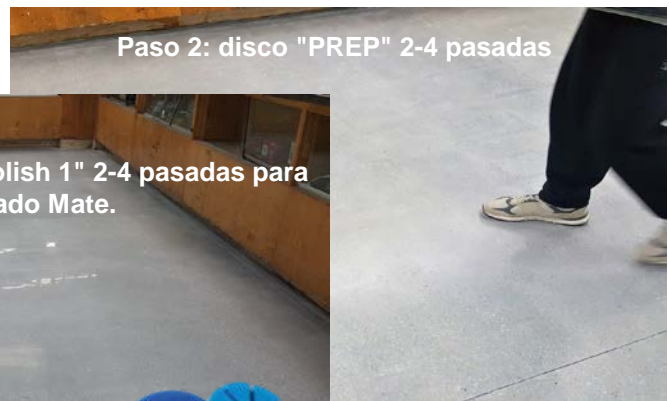
Paso 2: disco "PREP" 2-4 pasadas