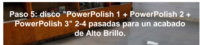
Paso 5: disco "PowerPolish 1 + PowerPolish 2 + PowerPolish 3" 2-4 pasadas para un acabado de Alto Brillo.