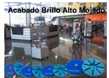
Acabado Brillo Alto Mojado